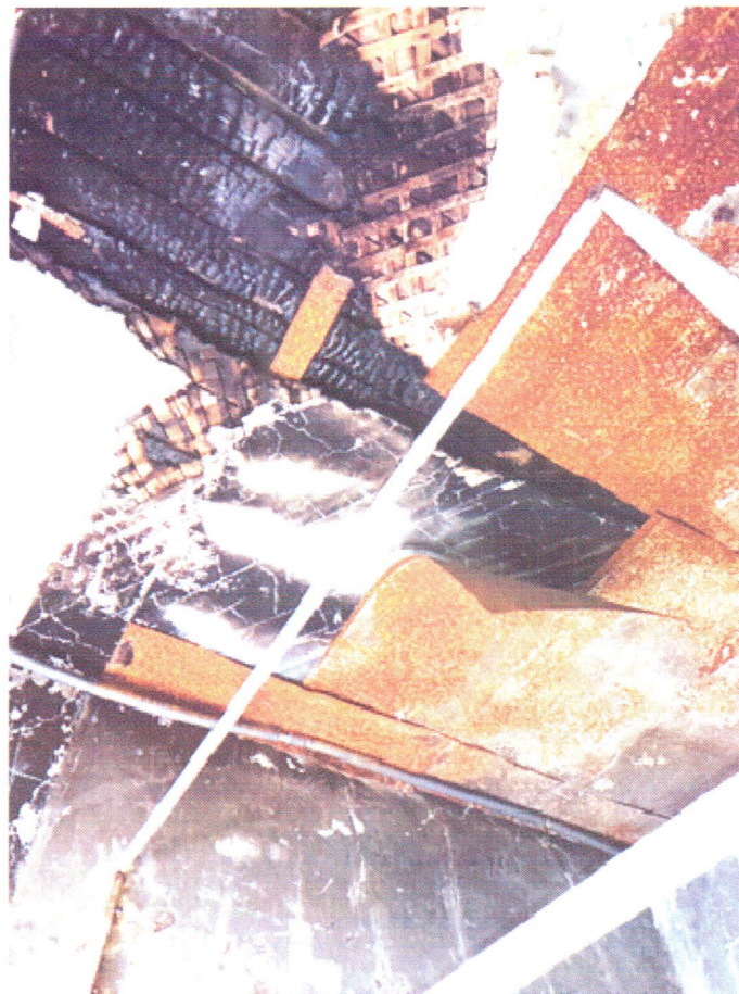
Фото 6. Повреждения деревянных перекрытий вследствие пожара

Ведущий консультант отдела по государственной охране и сохранению объектов культурного наследия регионального значения инспекции по охране объектов культурного наследия Приморского края