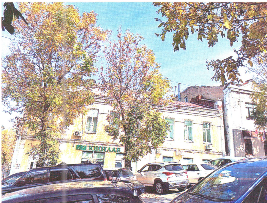
Фото 1. Юго-западный (главный) фасад

Приложение к п. 1.9 охранного обязательства объекта культурного наследия от 14 октября 2024 г.