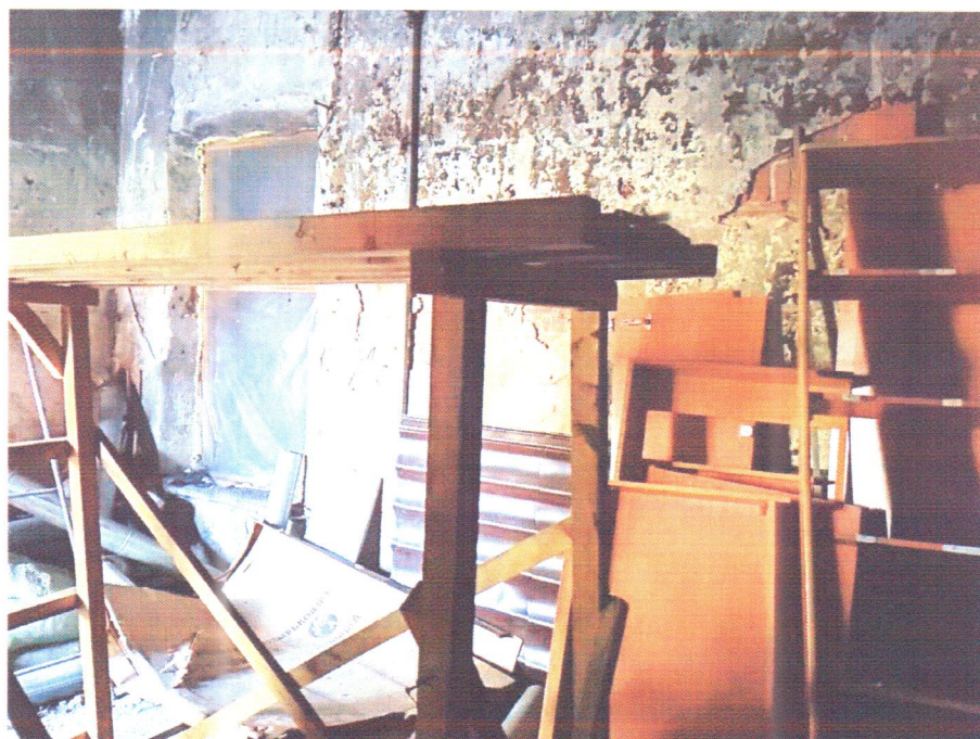
Фото 4. Помещение загромождено строительным мусором и разобранной мебелью. Вход в соседнее помещение загерметизирован.