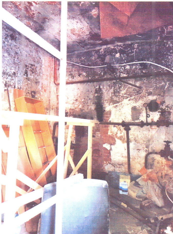
Фото 3. Помещение загромождено строительным мусором и разобранной мебелью.