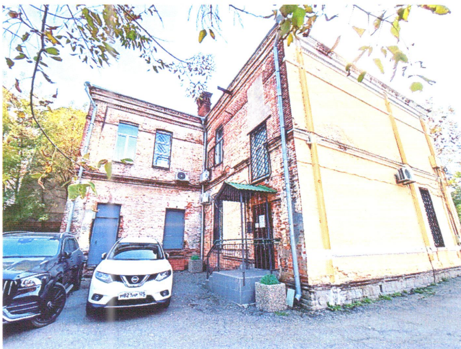
Фото 2. Северо-восточный (дворовой) и северо-западный фасады