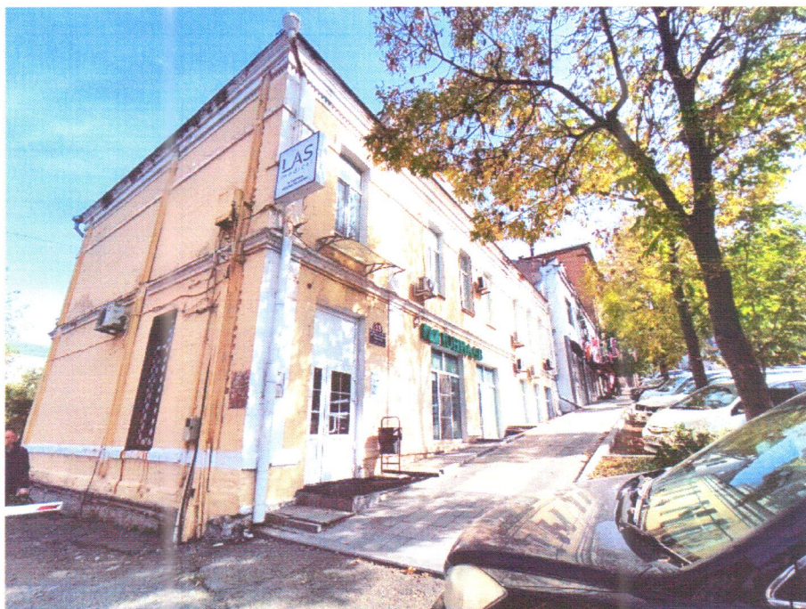
Фото 1. Юго-западный (главный фасад)