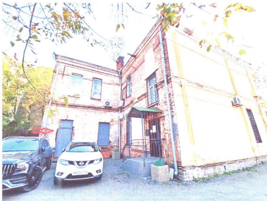
Фото 2. Отдельный вход в помещение с кадастровым номером 25:28:020012:413