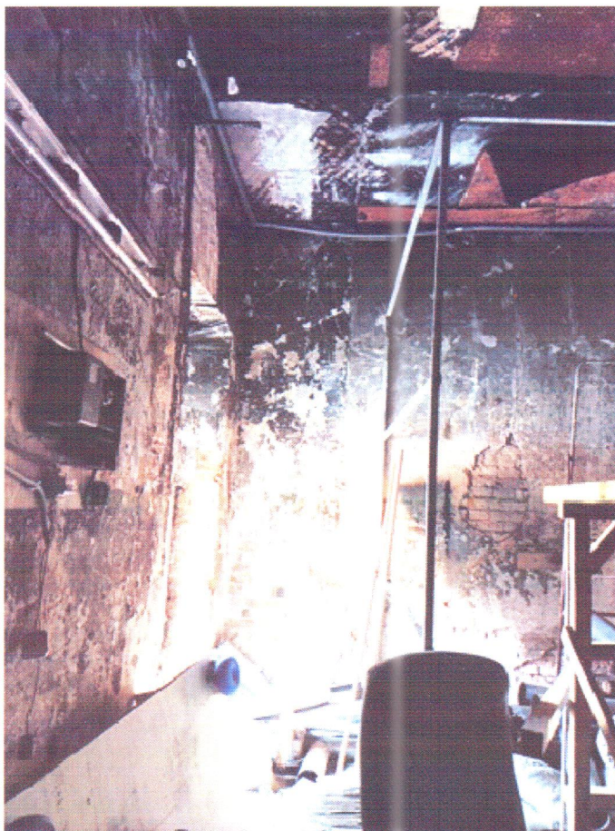
Фото 5. Повреждения вследствие пожара